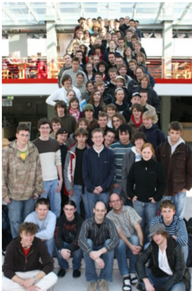
Abb. 2: Teilnehmerinnen am Schnupperstudium Informatik